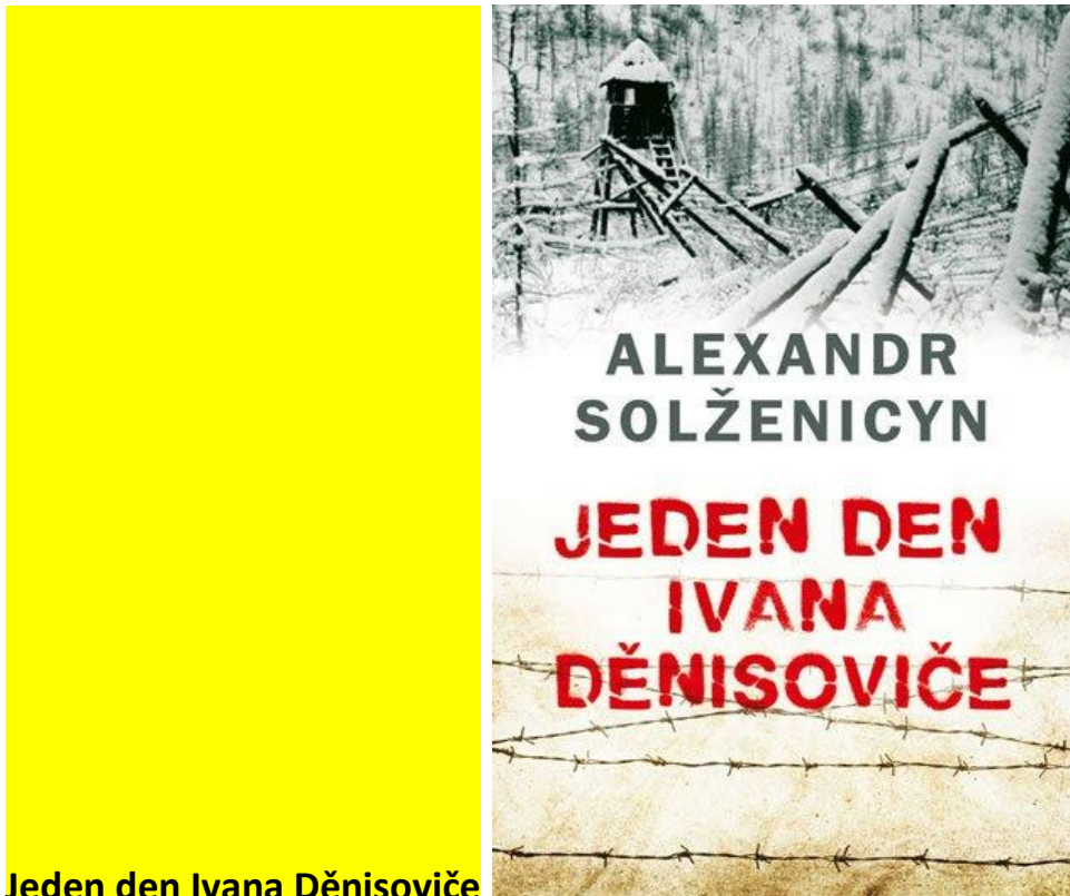
Jeden den Ivana Děnísoviče