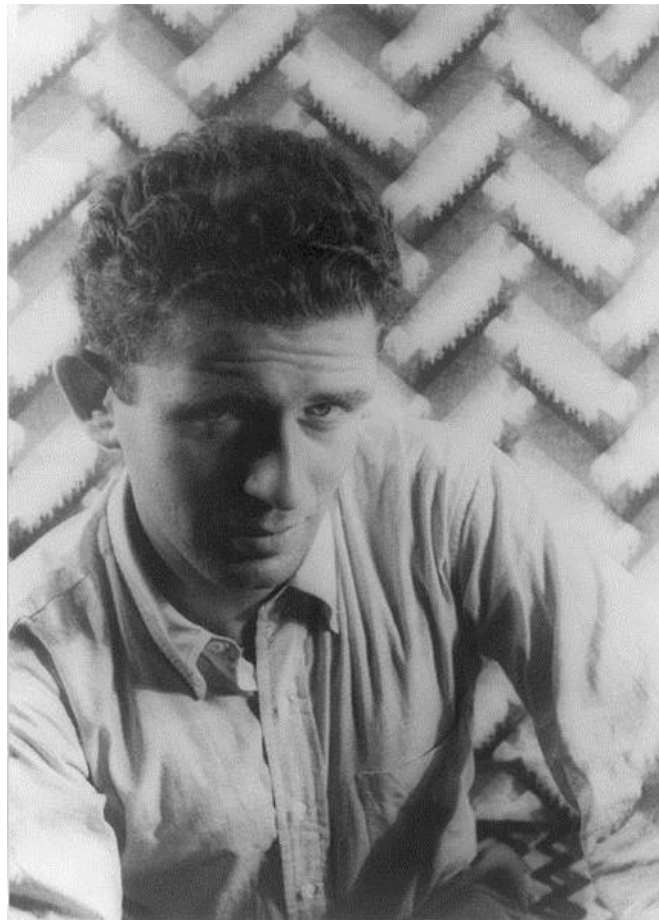
obr. 13. září 1948

Norman Kingsley Mailer [nórmen mejlr] (31. ledna 1923 Long Branch, New Jersey – 10. listopadu 2007) byl americký spisovatel, svými reportážemi a reportážními romány se zařadil k tzv. novému žurnalismu . Za své literární dílo byl dvakrát odměněn Pulitzerovou cenou .