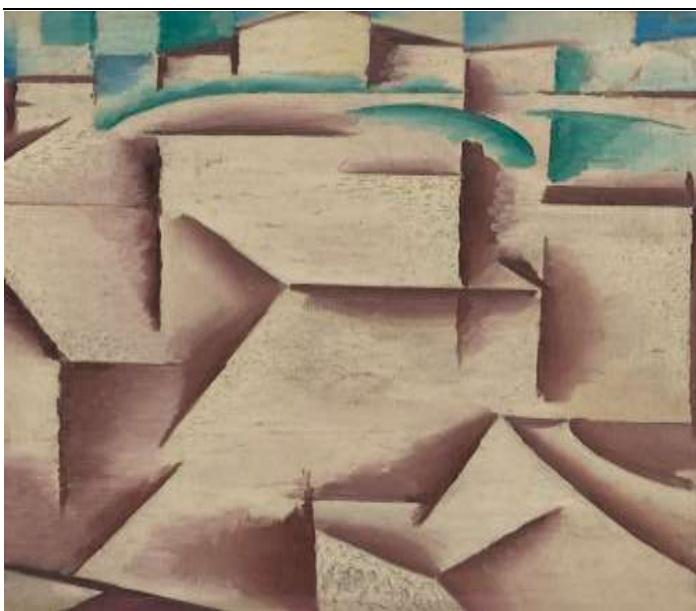
Josef Čapek: Kontemplace/Kubistická krajina.