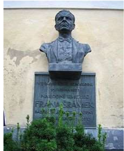
Obr. Pamětní deska na rodném domě Fráni Šrámka v Sobotce

Roku 1946 byl jmenován národním umělcem. Pohřben je na ve svém rodném městě Sobotce na soboteckém hřbitově, o kterém napsal jednu ze svých nejznámějších básní Sobotecký hřbitov.