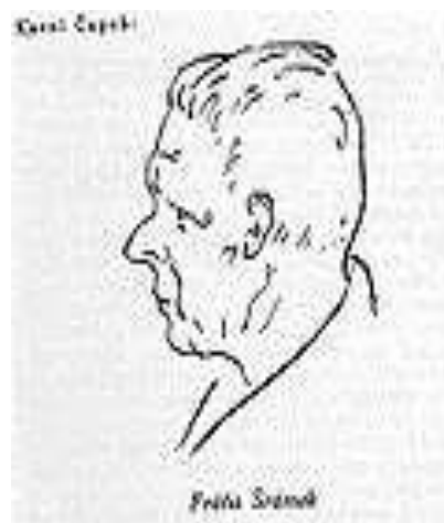
Obr. Karikatura F.Šrámka od Karla Čapka