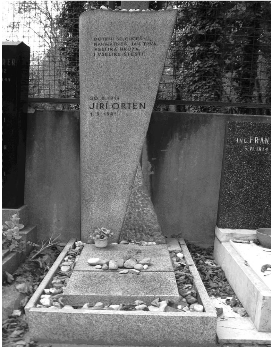
Hrob Jiřího Ortena na Novém židovském hřbitově v Praze.