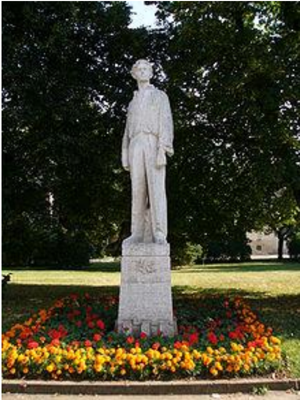
socha Jiřího Wolкера v Prostějově