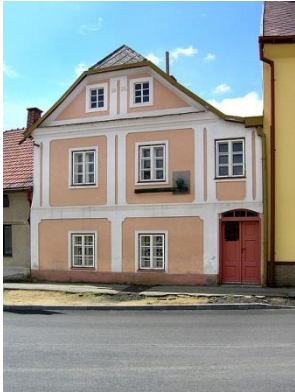
Obrázek 1: Rodný dům v Počátkách u Pelhřimova