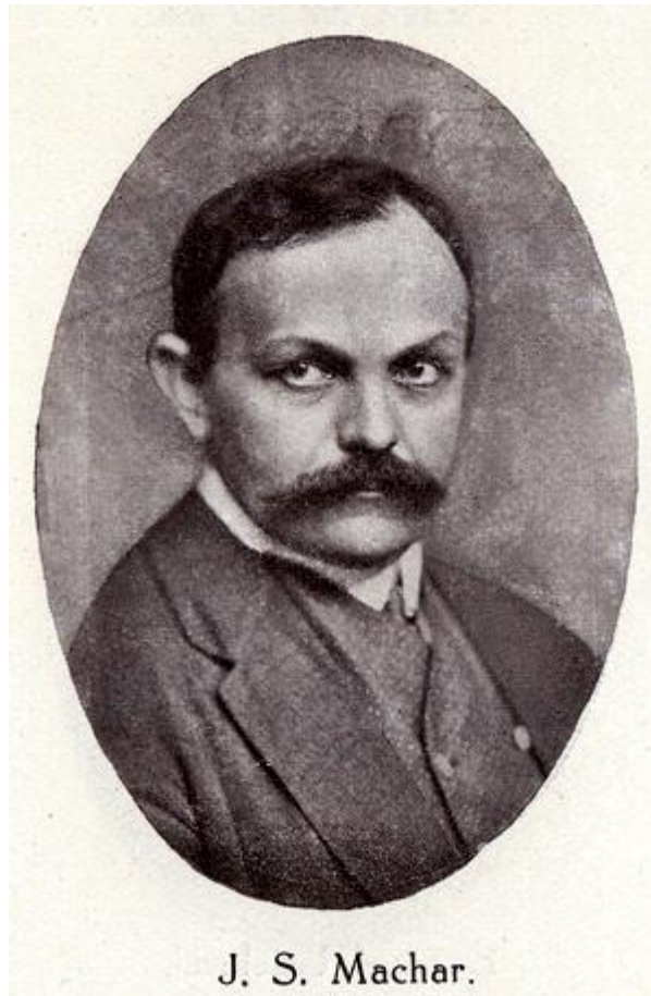
Obrázek: J.S. Machar před rokem 1923

Josef Svatoopluk Machar (29. února 1864 Kolín – 17. března 1942 Praha) byl český básník, prozaik, satirik, publicista a politik, spoluautor Manifestu České moderny a představitel kritického realismu.