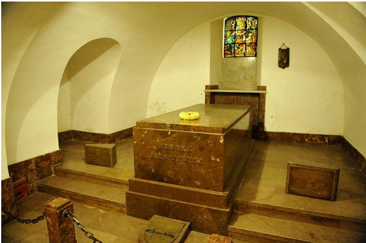
Obrázek 3: Hrobka Sienkiewiczze ve Varšavě