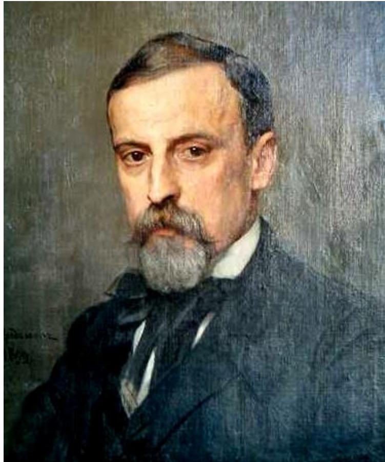
Obrázek 1: r.1899

Henryk Adam Aleksander Pius Sienkiewicz (5. května 1846, Wola Okrzejska – 15. listopadu 1916, Vevey, Švýcarsko), byl polský spisovatel, nositel Nobelovy ceny za literaturu z roku 1905. Největší slávu získal svými historickými romány, týkajícími se polských a křesťanských dějin. Představitel polského pozitivismu . Psal rovněž pod pseudonymem Litwos.