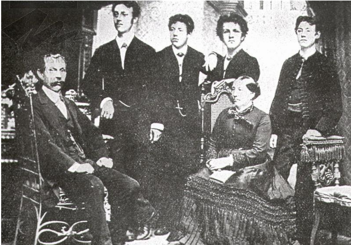
Obrázek 1: Mrštíkové - společná rodinná fotografie z roku 1886.