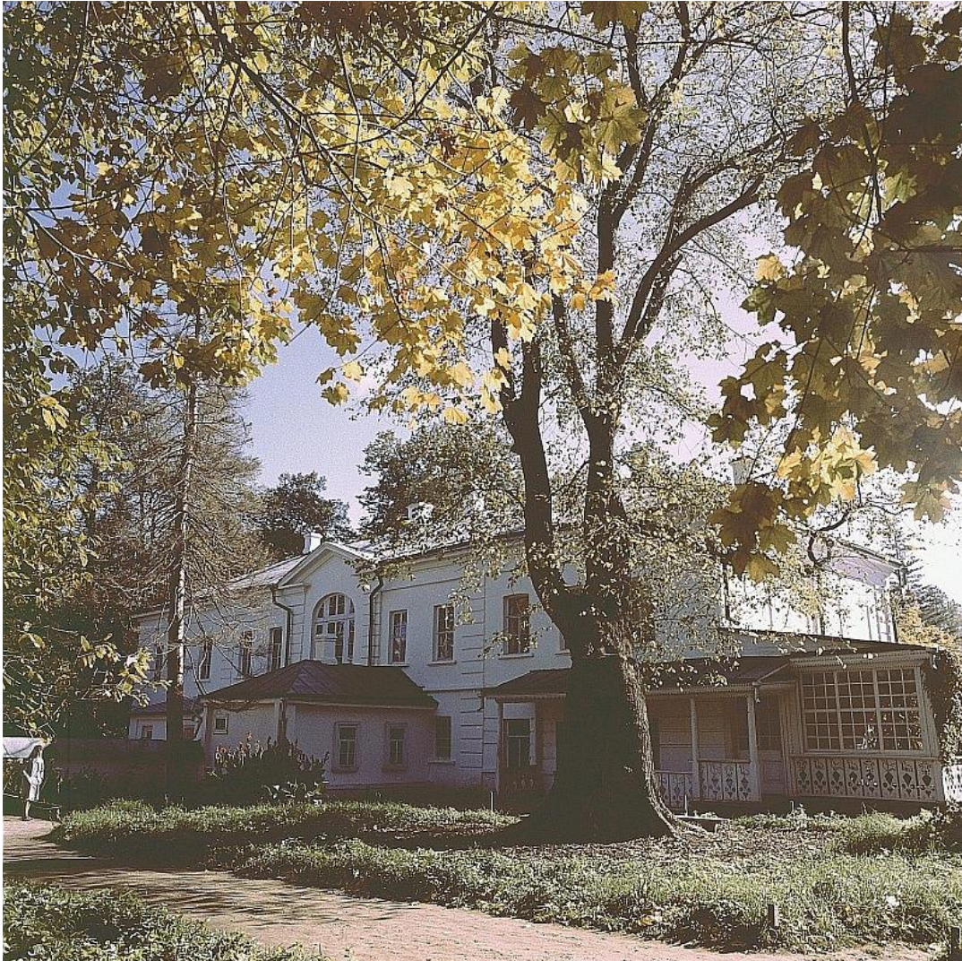
Obrázek : Jasnaja Poljana