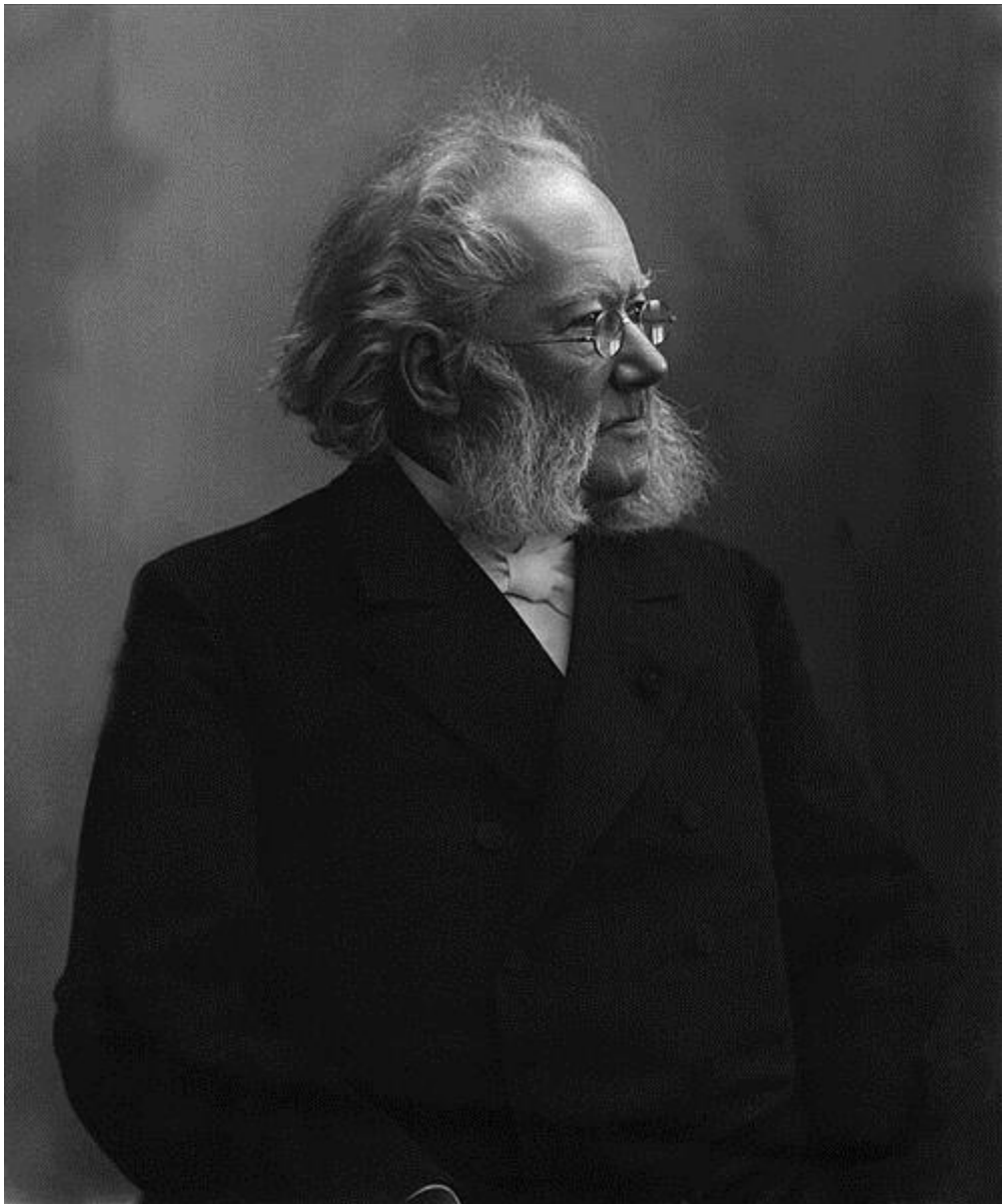
Obrázek 1: Henrik Ibsen

Henrik Johan Ibsen (20. března 1828 Skien – 23. května 1906 Oslo) byl norský dramatik a básník. Je považován za zakladatele realistického dramatu .