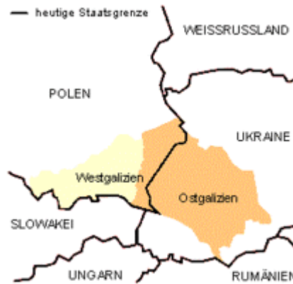
Obrázek: Halič (stav v letech 1849-1918) na dnešní mapě Evropy