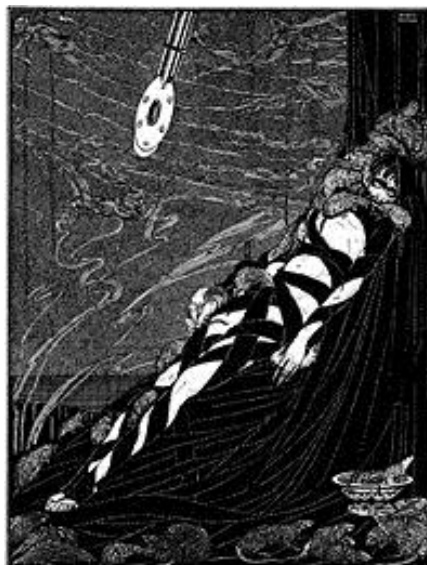
Ilustrace Harryho Clarka, 1919