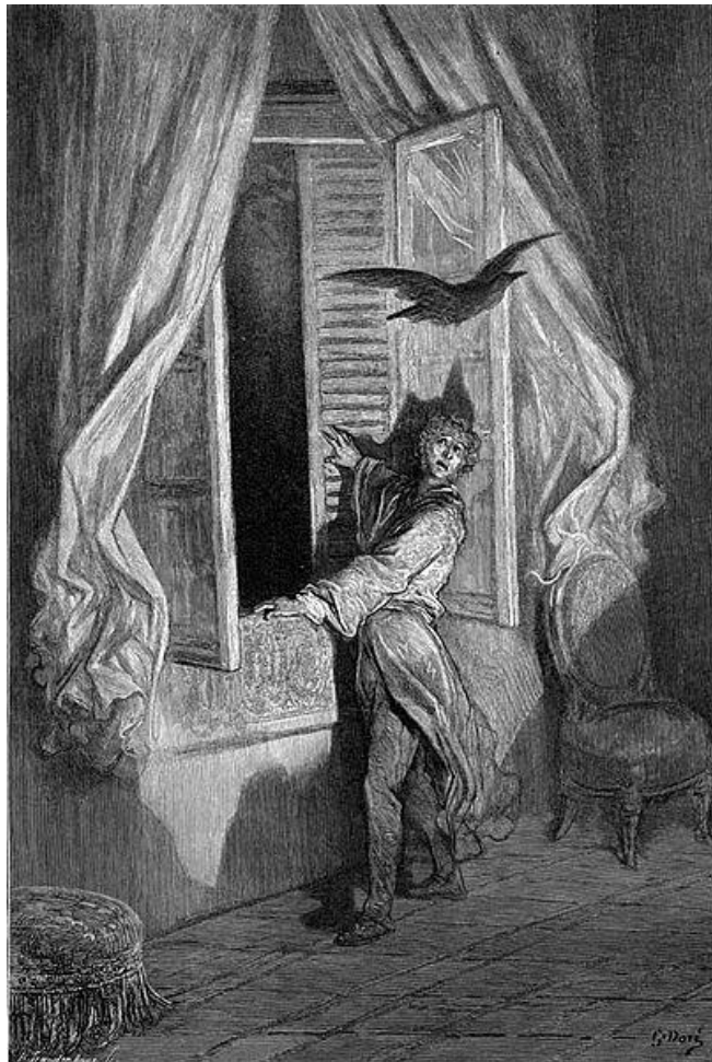
Ilustrace k básni Havran od Gustava Dore (1884)