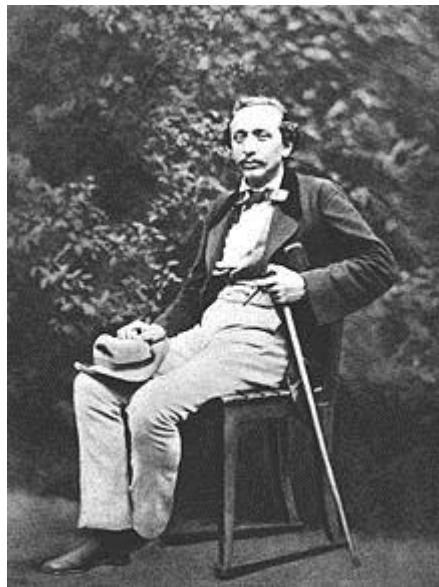
Na snímku mladý Jan Neruda.

Celý život prožil ve finanční nouzi, stáří prožil osamocen, velmi často nemocný .