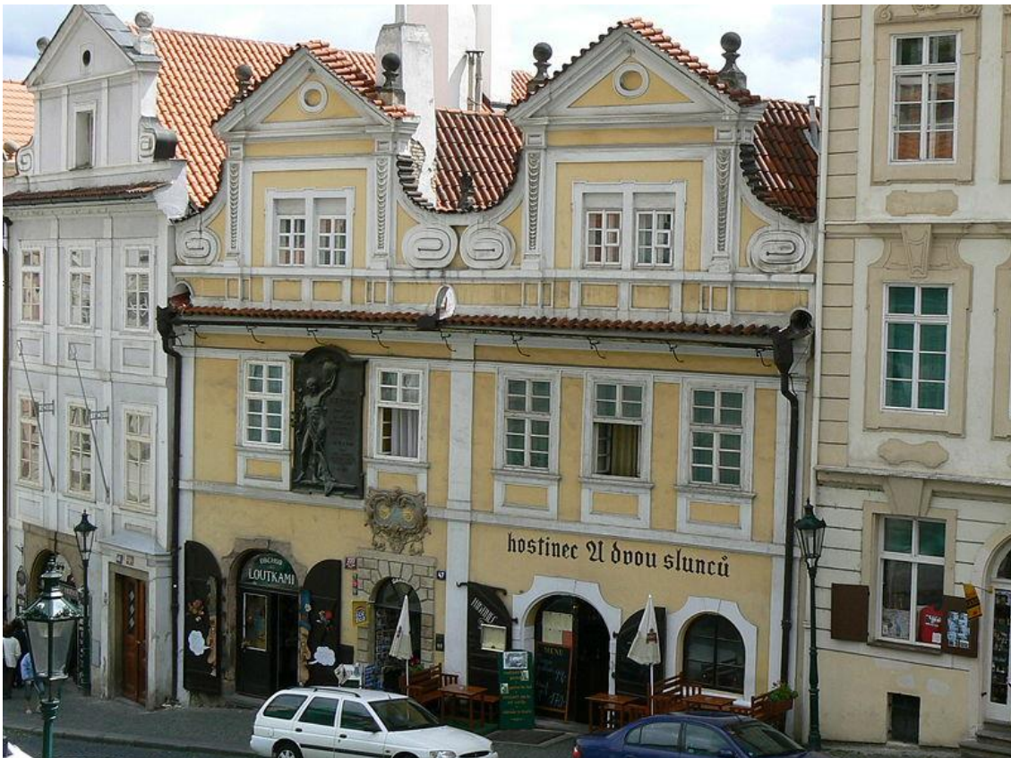
Dům U Dvou Slunců v Nerudově ulici

v renomovaných redakcích deníků Čas, Hlas . Jako novinář poté zakotvil v redakci mladočeských Národních listů , kde setrval až do konce svého života.