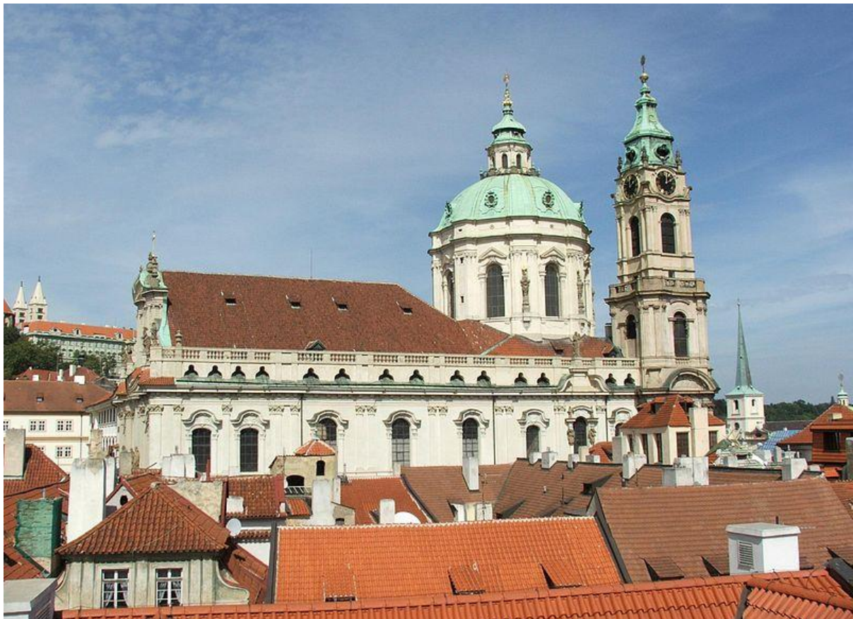
chrám sv. Mikuláše na Malé Straně

Tragicky končí i povídka Jak si pan Vorel nakouřil pěnovku , jehož jakožto podnikatele-cizince místní okruh obyvatel nepřijal za svého.