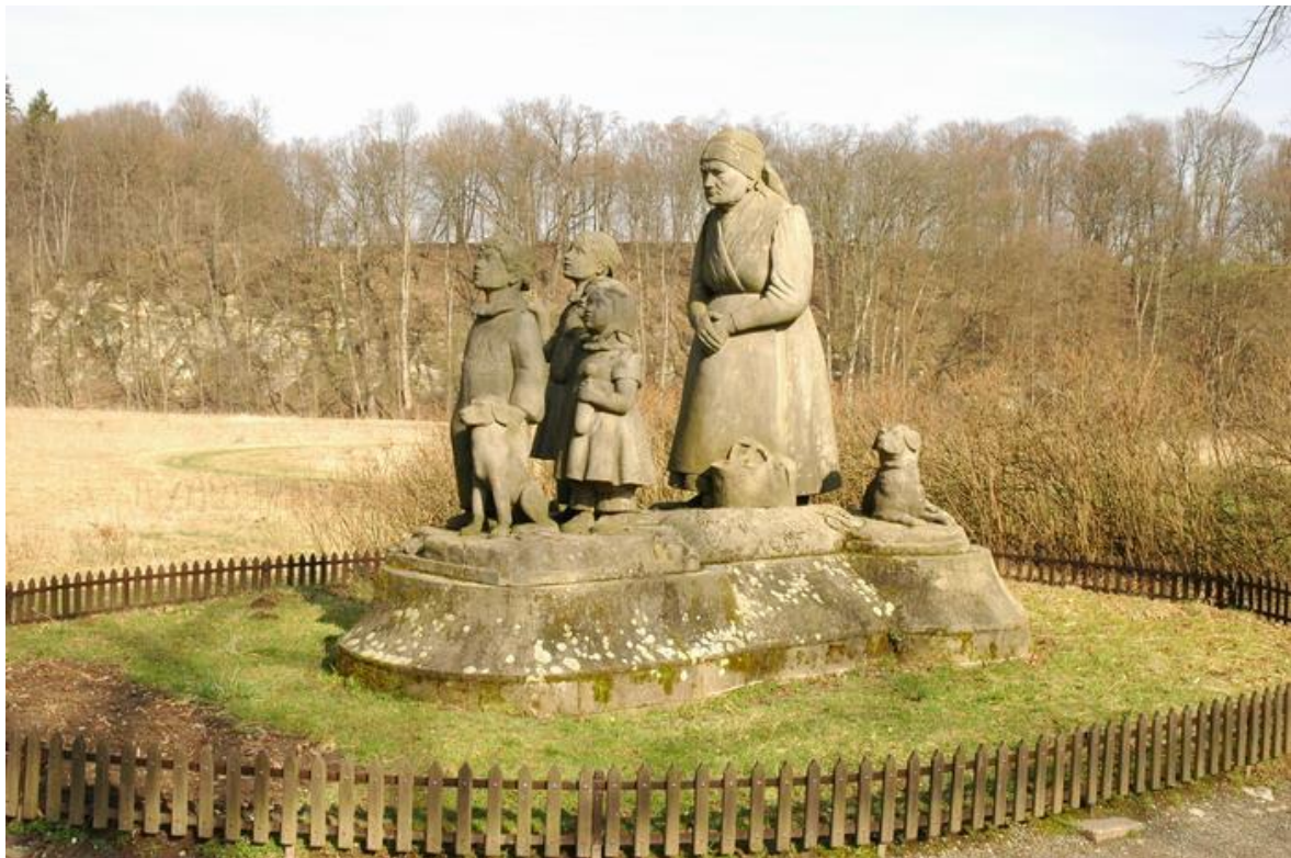
Sousoší Babička s dětmi v Ratibořicích

Přestože o Němcové a jejím díle existuje rozsáhlá odborná literatura, neznamená to, že všechny otázky týkající se interpretace jsou uzavřené a dořešené. Živá je otázka vzájemného vztahu realismu, romantismu a biedermeieru v tomto díle.