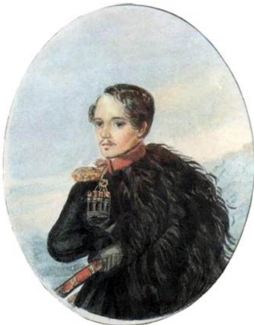
Lermontův autoportrét (1837)