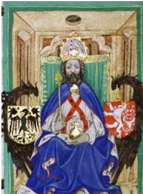
Karel IV, český a římský král, na miniatuře Gelnausenově kodexu