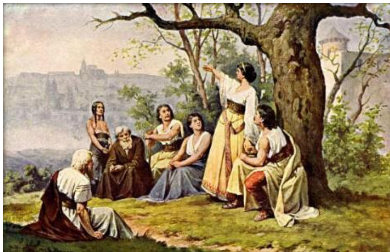
Josef Mathauser: Kněžna Libuše věští slávu Prahy