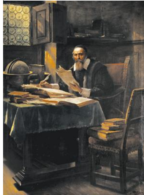
Václav Brožík - J. A. Komenský ve své pracovně v Amsterdamu (1891)