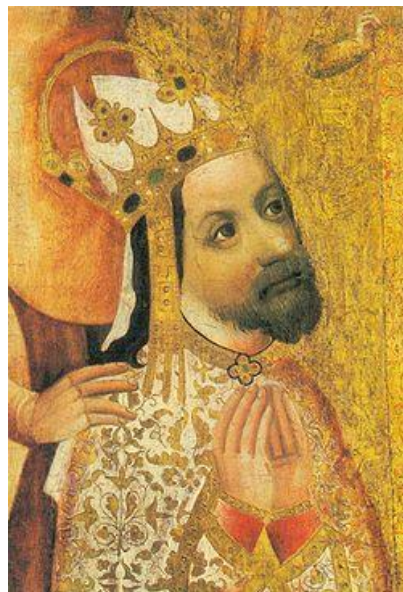
Karel IV. (1316-1378), doba vlády 1346 - 1378

Literaturu „pracovně“ dělíme do dvou etap s mezníkem v 50. letech 14. století , tedy po nástupu Karla IV. na český trůn. Během jeho vlády dosahuje česky psaná středověká tvorba vrcholu.