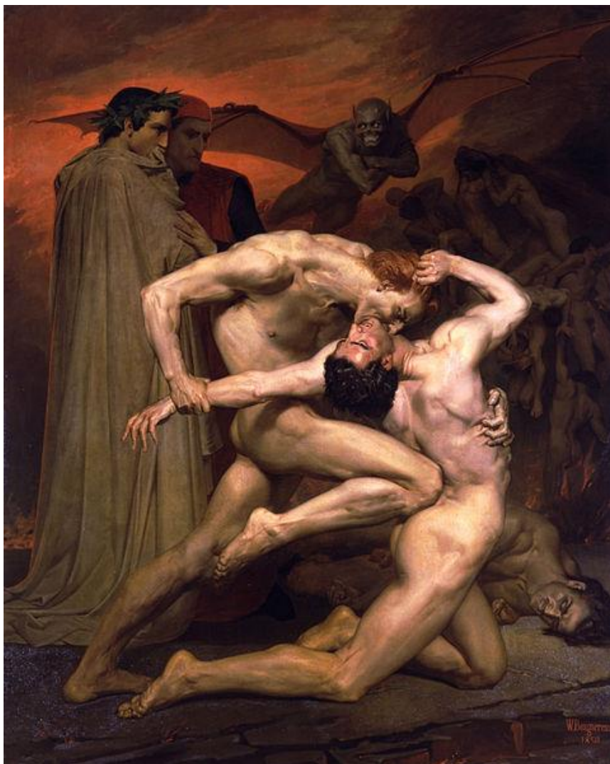
William Adolphe Bouguereau: Dante a Vergilius v pekle (1850)

Domácí úkol: Zopakujte si nejznámější antické báje.