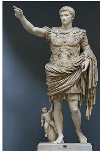
Forum Romanum; Augustus – první římský císař ( www.wikipedia.cz )