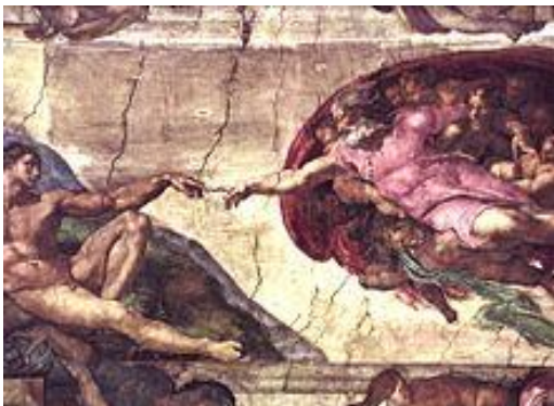
(Michelangelova freska Stvoření Adama v Sixtinské kapli)

Nechte se inspirovat příklady na obrázku: